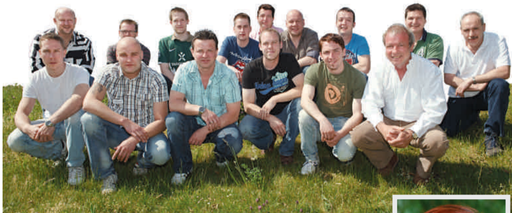
Auch der Trockenbaukurs 2011 traf sich zum Einführungstag in Allensbach am Bodensee.

Allensbach, Erfurt • Wer in Deutschland den Meistertitel im Maler- und Lackierhandwerk erlangen will, bereitet sich in der Regel auf Meisterschulen darauf vor. Doch welche Möglichkeit haben jene, welche aus finanziellen oder privaten Gründen nicht für ein halbes oder ganzes Jahr aus dem Berufsleben aussteigen können? Ihnen bietet die Führungsakademie zusammen mit der Online-Meisterschule eine interessante Alternative. Mit dabei: die Unternehmensgruppe Heinrich Schmid als Bildungspartner.