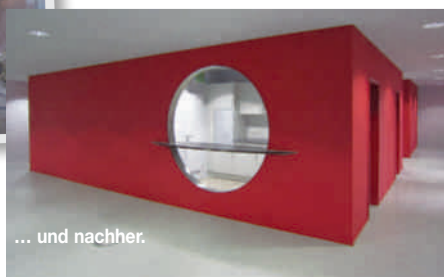
... und nachher