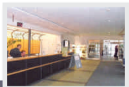
Heinrich-Schmid-Projekt Bürotage in Stuttgart, vorher ...

Nach dem tollen Erfolg des Fotowettbewerbs im Februar rufen wir Sie hiermit erneut dazu auf, die Kamera zu zücken. Alle HS-Mitarbeiter sind herzlich dazu eingeladen, ihre schönsten oder eindrucksvollsten Baustellen durch Vorher-Nachher-Bilder zu dokumentieren.